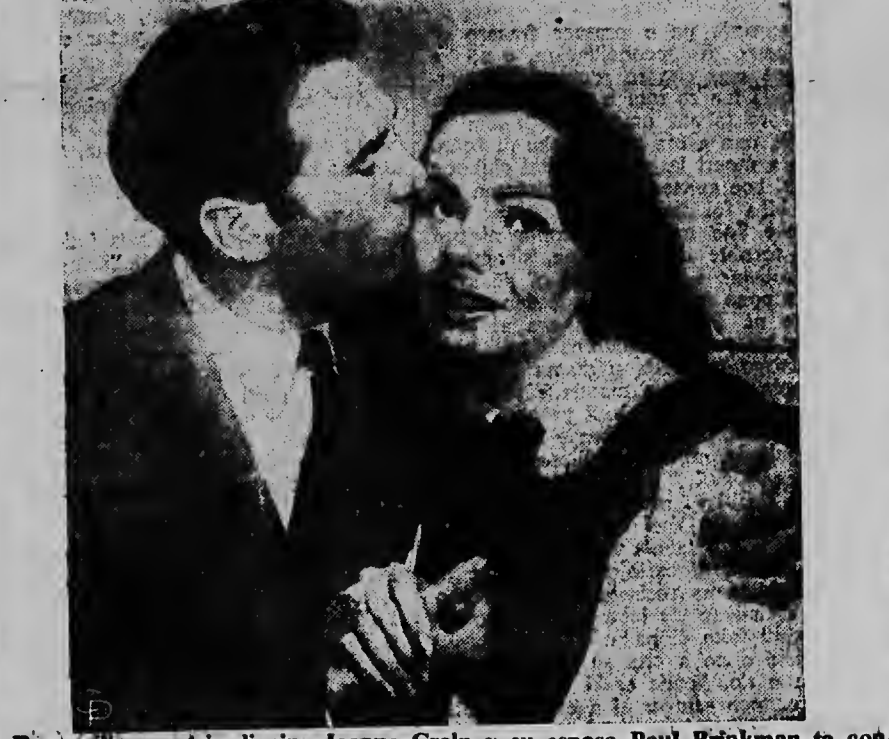
Reconcilia e actriz di cine Jeanne Crain y su esposo Paul Brinkman ta con- ferenciaando cu sinak parce na nan cas na Los Angeles, planeando cu nan lo celebra nan di dos luna de miel cu lo ta un trip na Hawaii. I cu esel un di idillonan di Hollywood ta sigui su curso.